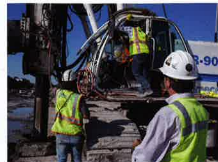
La tecnología de monitoreo de rendimiento en la cabina garantizó el mantenimiento de la calidad durante todo el proceso en el que instalaron más de 8.400 columnas.

como un soporte para la vía o “causeway” y se asegura de que la capacidad de carga del suelo es lo suficiente para soportar las cargas estáticas y dinámicas generadas por el tráfico de vehículos.