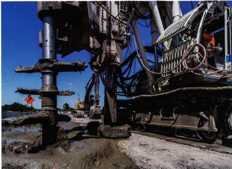
Varias columnas son colocadas en el suelo para proporcionar las propiedades geomecánicas necesarias. En total, se instalaron 1.500 columnas dobles midiendo 13,7 metros.

de precaución en la parte externa (este) del terraplén central y estos ofrecieron resultados similares, lo que demuestra que no había una capa de rodadura bien definida. Esta situación geológica llevó a los ingenieros de Skanska, Parsons Brinkerhoff y Treviicos a utilizar una solución que garantizara la capacidad de carga y durabilidad requeridas por el director, también en el caso de un huracán destructivo que pudiera ocurrir una vez cada 100 años.